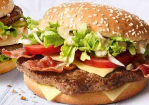
Big Tasty® Bacon

Bei McDonald's® 5x in Ingolstadt www.mcd-ingolstadt.de